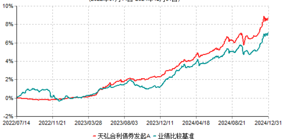
天弘合利债券发起A累计净值增长率与业绩比较基准收益率历史走势对比图 (2022年07月14日-2024年12月31日)