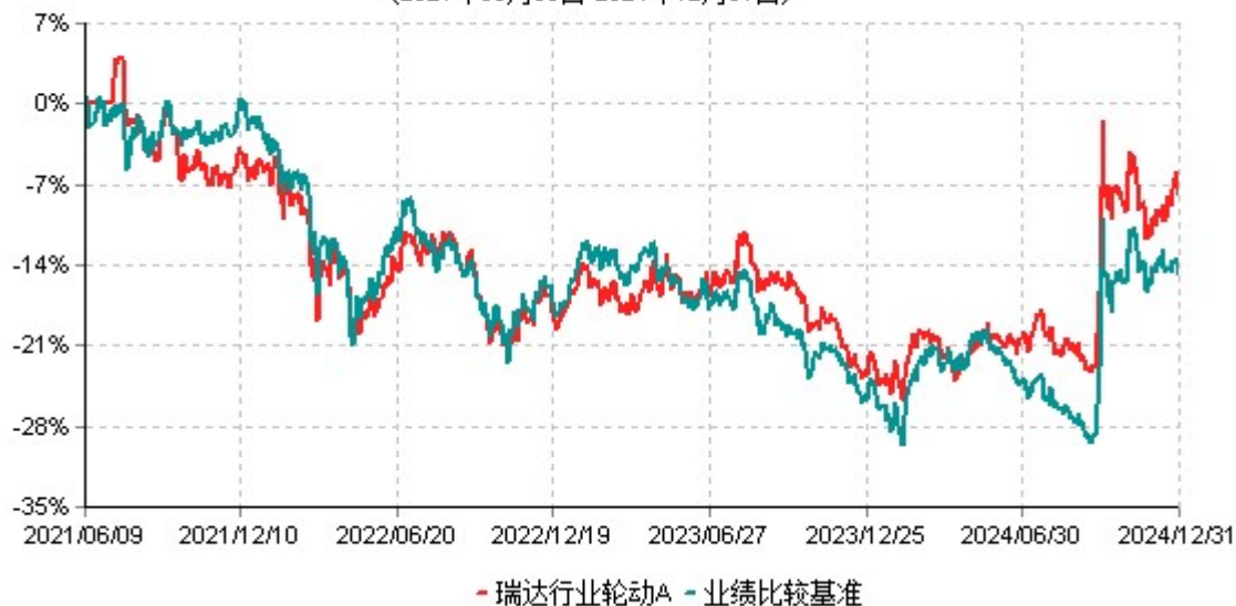
瑞达行业轮动A累计净值增长率与业绩比较基准收益率历史走势对比图 (2021年06月09日-2024年12月31日)