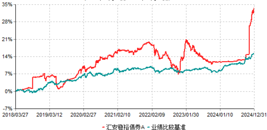
汇安稳裕债券A累计净值增长率与业绩比较基准收益率历史走势对比图 (2018年03月27日-2024年12月31日)