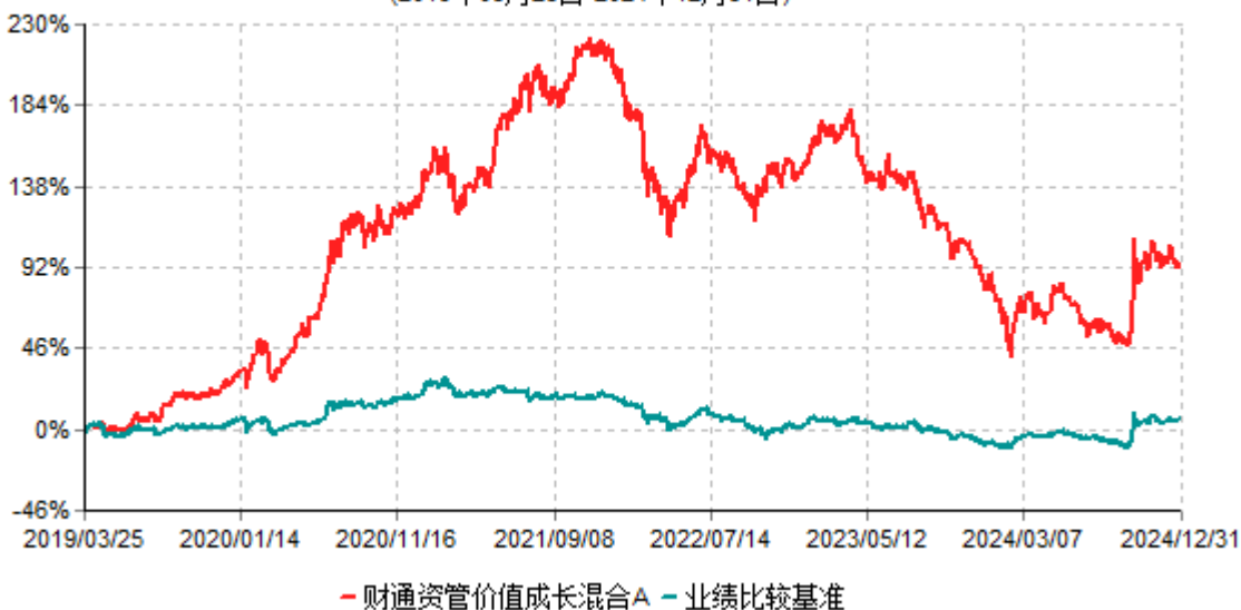
财通资管价值成长混合A累计净值增长率与业绩比较基准收益率历史走势对比图 (2019年03月25日-2024年12月31日)