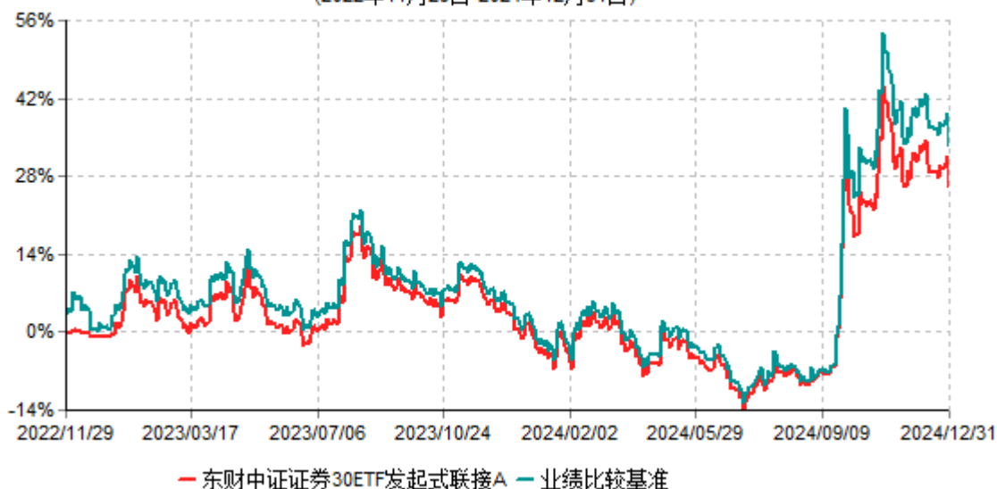
东财中证证券30ETF发起式联接A累计净值增长率与业绩比较基准收益率历史走势对比图 (2022年11月29日-2024年12月31日)