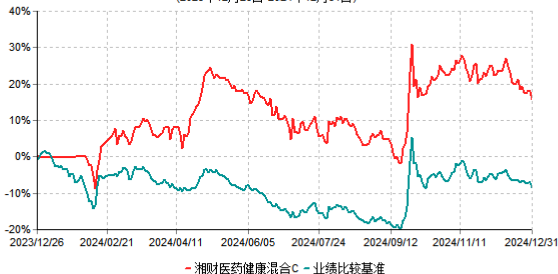
湘财医药健康混合C累计净值增长率与业绩比较基准收益率历史走势对比图 (2023年12月26日-2024年12月31日)