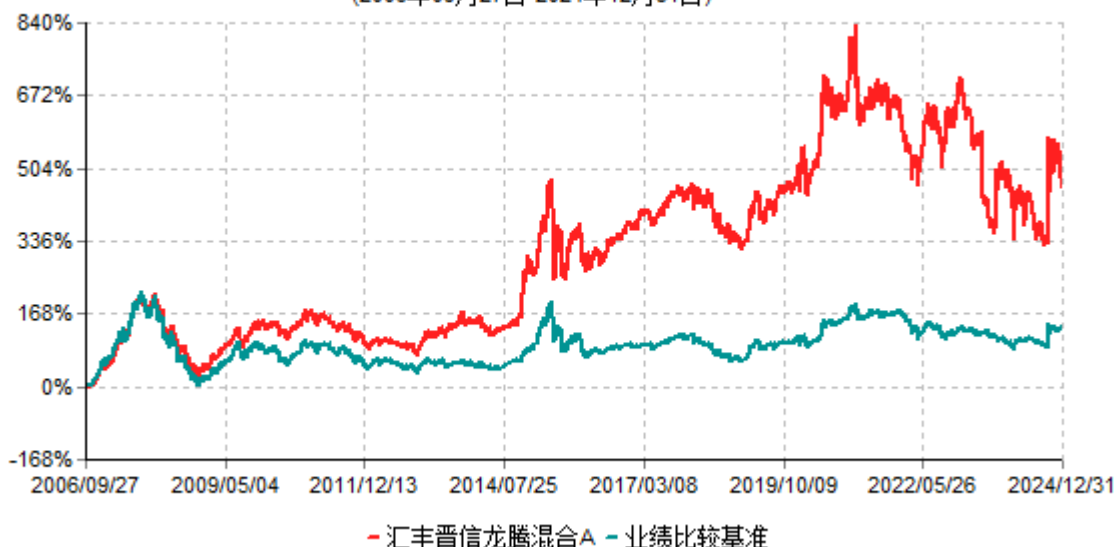
汇丰晋信龙腾混合A累计净值增长率与业绩比较基准收益率历史走势对比图 (2006年09月27日-2024年12月31日)