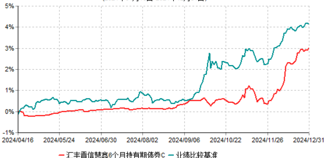
汇丰晋信慧鑫6个月持有期债券C累计净值增长率与业绩比较基准收益率历史走势对比图 (2024年04月16日-2024年12月31日)