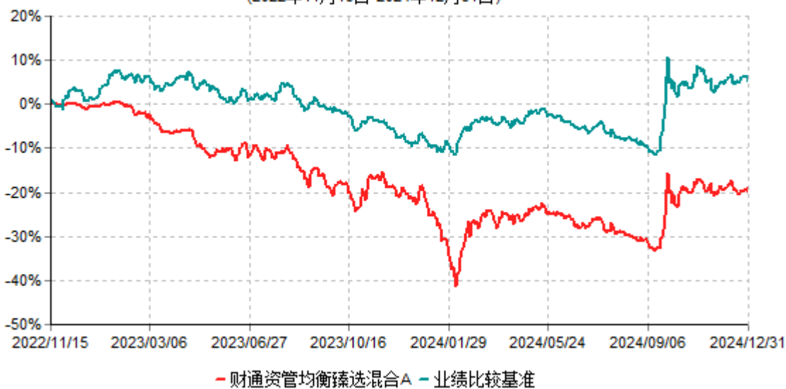
财通资管均衡臻选混合A累计净值增长率与业绩比较基准收益率历史走势对比图 (2022年11月15日-2024年12月31日)