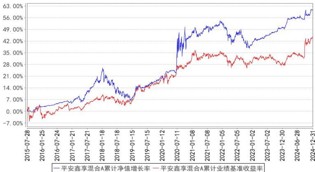
平安鑫享混合A累计净值增长率与同期业绩比较基准收益率的历史走势对比图