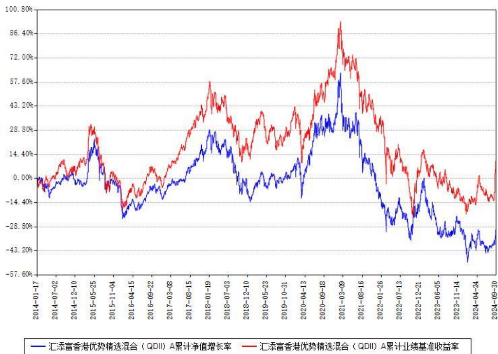
汇添富香港优势精选混合(QDII)A累计净值增长率与同期业绩基准收益率对比图