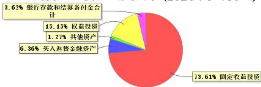
投资组合资产配置图表(2024年9月30日)