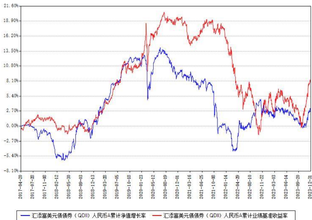
汇添富美元债债券（QDII）人民币C累计净值增长率与同期业绩基准收益率对比图