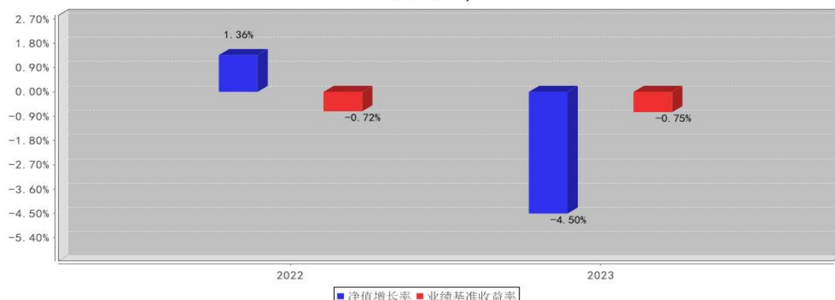
兴证资管金麒麟恒睿致远一年持有期混合C基金每年净值增长率与同期业绩比较基准收益率的对比图（2023年12月31日）

注：1、业绩表现截止日期 2023 年 12 月 31 日。产品过往业绩不代表未来表现。