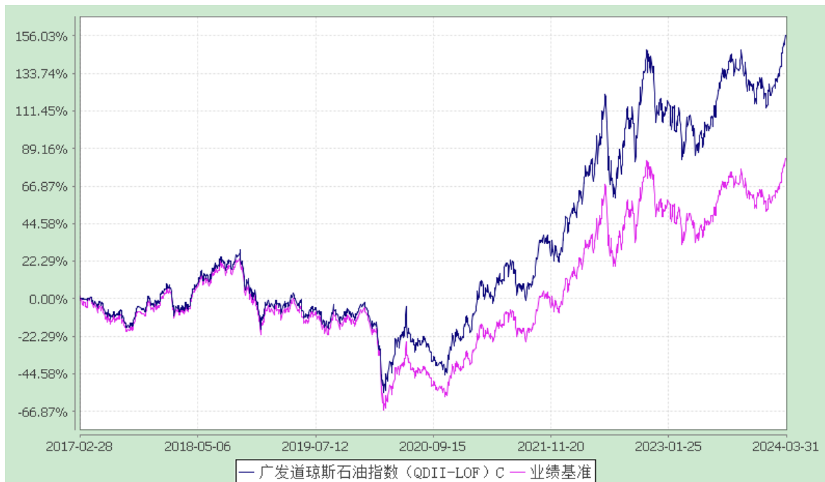
(3) 广发道琼斯石油指数 (QDII-LOF) E: