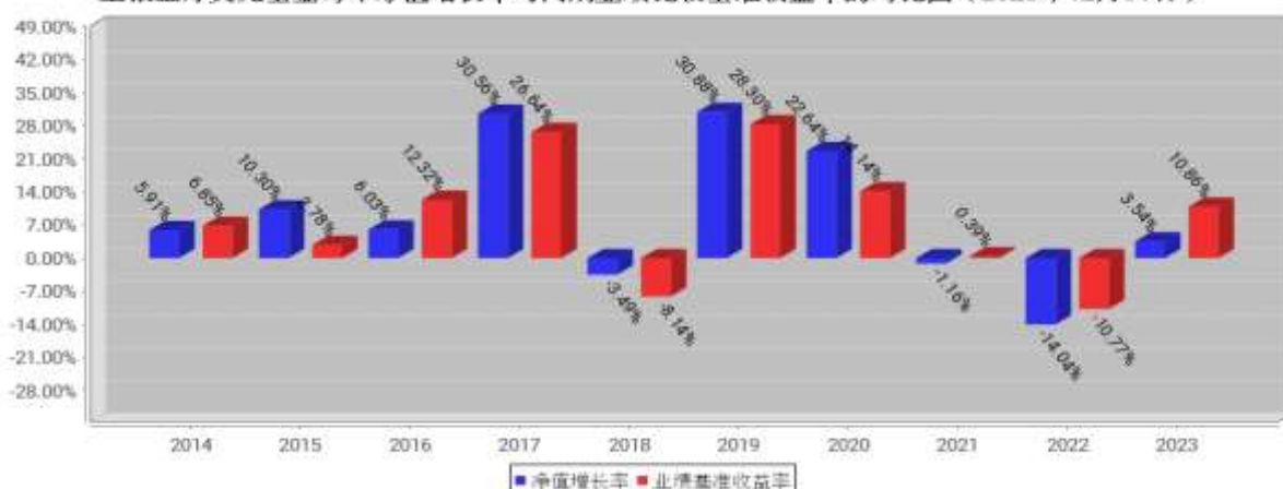
工银全球美元基金每年净值增长率与同期业绩比较基准收益率的对比图（2023年12月31日）

注：1、本基金基金合同于 2008 年 2 月 14 日生效。合同生效当年不满完整自然年度的，按实际期限计算净值增长率。