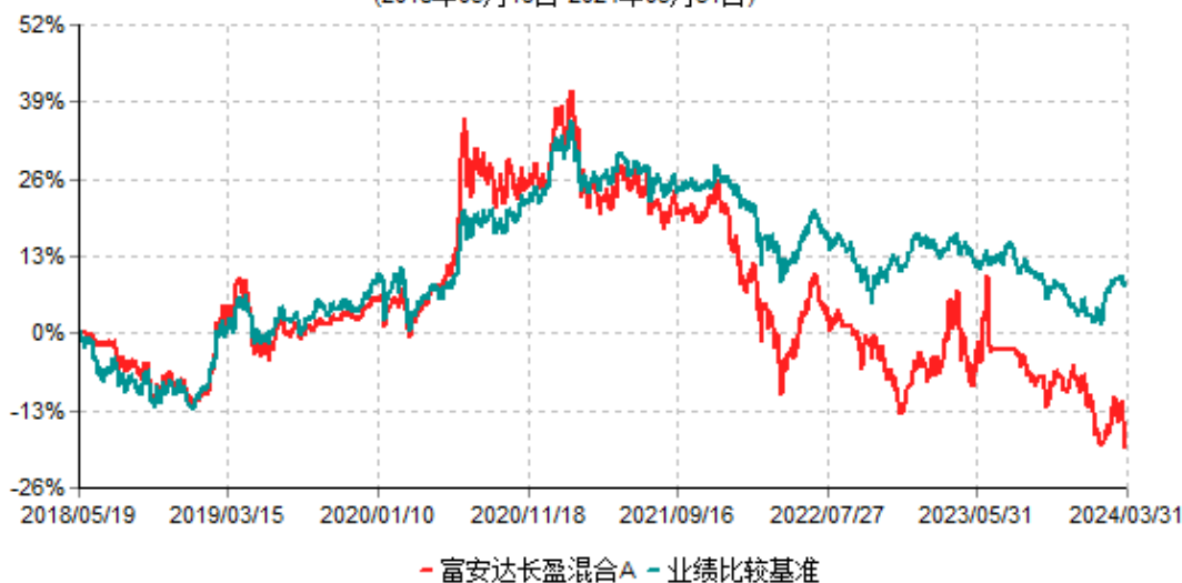
富安达长盈混合A累计净值增长率与业绩比较基准收益率历史走势对比图 (2018年05月19日-2024年03月31日)