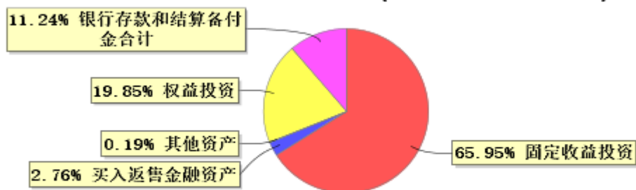
投资组合资产配置图表(2024年12月31日)

● 固定收益投资 ● 买入返售金融资产 ● 其他资产 ● 权益投资 ● 银行存款和结算备付金合计