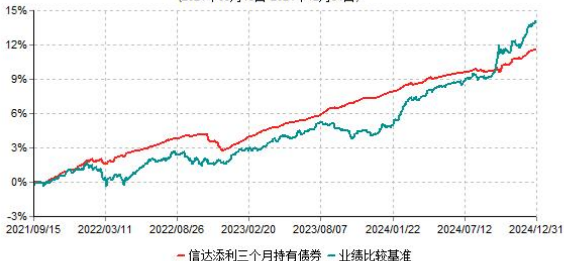
信达添利三个月持有期债券型集合资产管理计划累计净值增长率与业绩比较基准收益率历史走势对比图 (2021年09月15日-2024年12月31日)