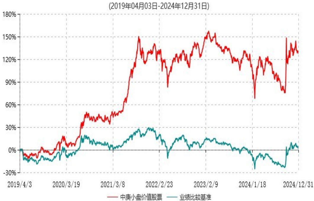
中庚小盘价值股票型证券投资基金累计净值增长率与业绩比较基准收益率历史走势对比图