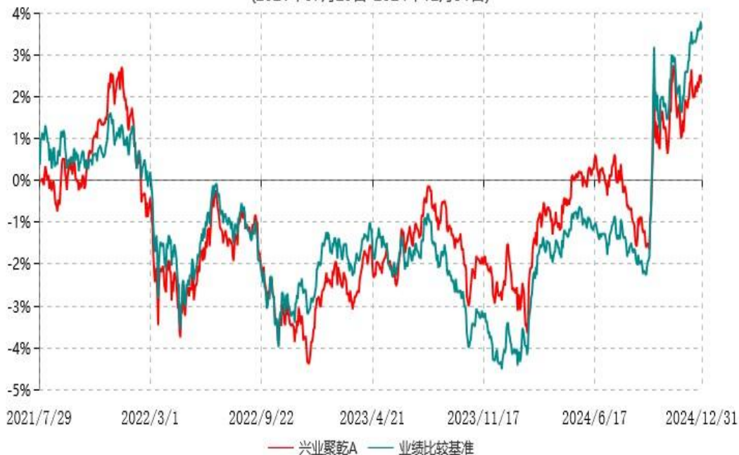
兴业聚乾C累计净值增长率与业绩比较基准收益率历史走势对比图