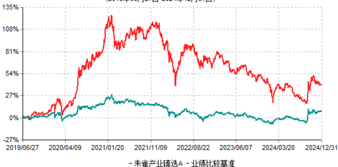
朱雀产业臻选A累计净值增长率与业绩比较基准收益率历史走势对比图 (2019年06月27日-2024年12月31日)