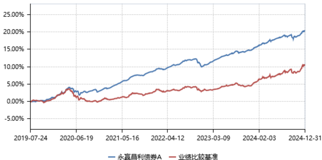
永赢昌利债券A累计净值收益率与业绩比较基准收益率历史走势对比图 (2019年07月24日-2024年12月31日)