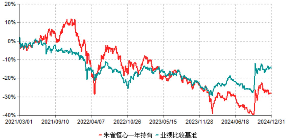
朱雀恒心一年持有累计净值增长率与业绩比较基准收益率历史走势对比图 (2021年03月01日-2024年12月31日)