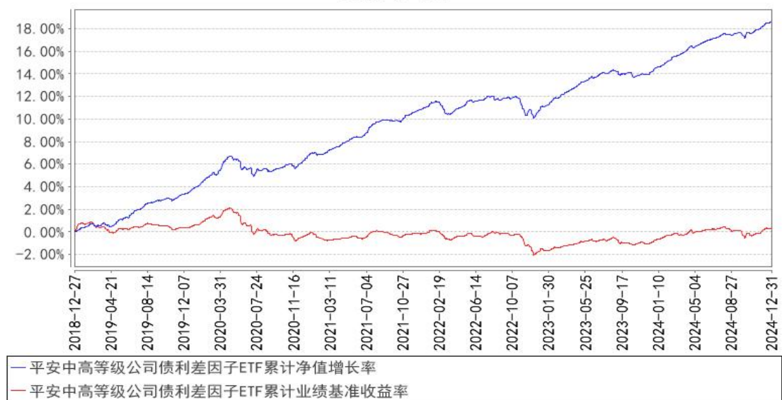
平安中高等级公司债利差因子ETF累计净值增长率与同期业绩比较基准收益率的历史走势对比图