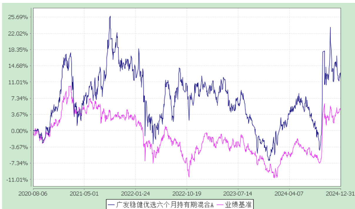
广发稳健优选六个月持有期混合 C