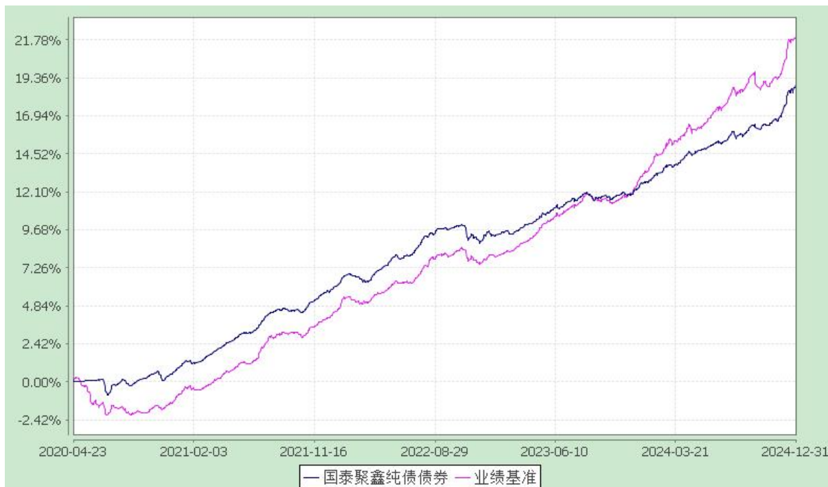
自基金合同生效以来份额累计净值增长率与业绩比较基准收益率的历史走势对比图 (2020 年 4 月 23 日至 2024 年 12 月 31 日)

注：本基金合同生效日为 2020 年 4 月 23 日。本基金在六个月建仓期结束时，各项资产配置比例符合合同约定。