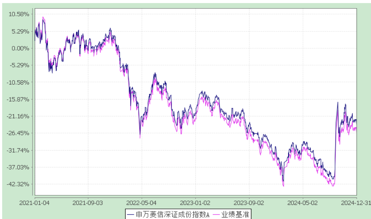
申万菱信深证成份指数 C