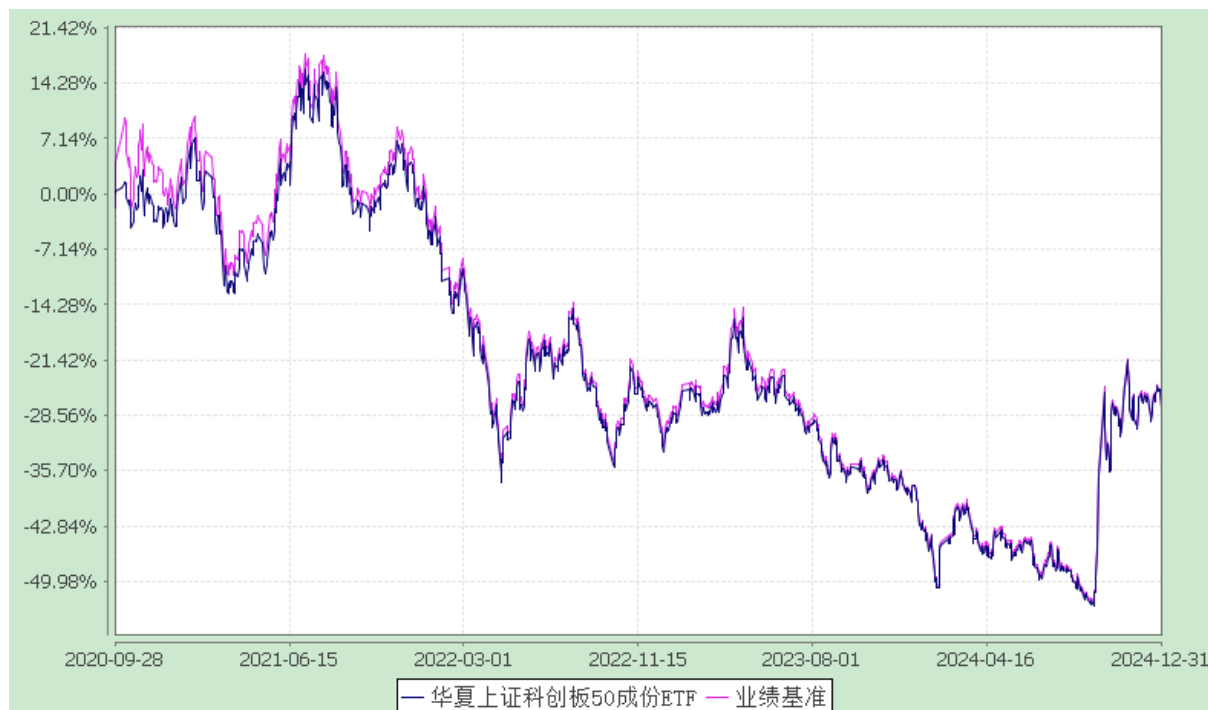
华夏上证科创板 50 成份交易型开放式指数证券投资基金 份额累计净值增长率与业绩比较基准收益率历史走势对比图 (2020 年 9 月 28 日至 2024 年 12 月 31 日)