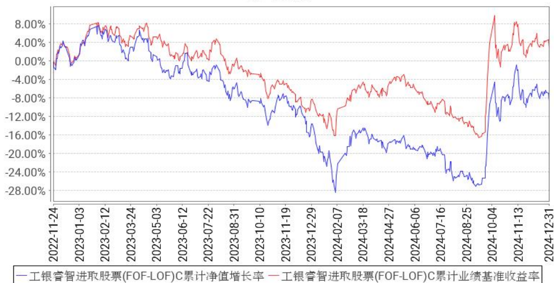
工银睿智进取股票(FOF-LOF)C累计净值增长率与同期业绩比较基准收益率的历史走势对比图

注：1、本基金于2022年11月24日由“工银瑞信睿智进取一年封闭运作股票型基金中基金（FOF-LOF）”转型而来。