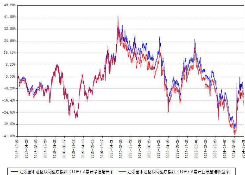
汇添富中证互联网医疗指数（LOF）A 累计净值增长率与同期业绩比较基准收益率对比图