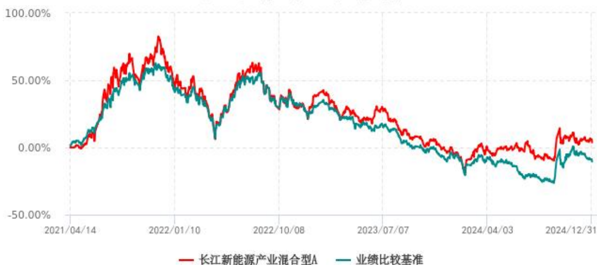
长江新能源产业混合型A累计净值增长率与业绩比较基准收益率历史走势对比图 (2021年04月14日-2024年12月31日)