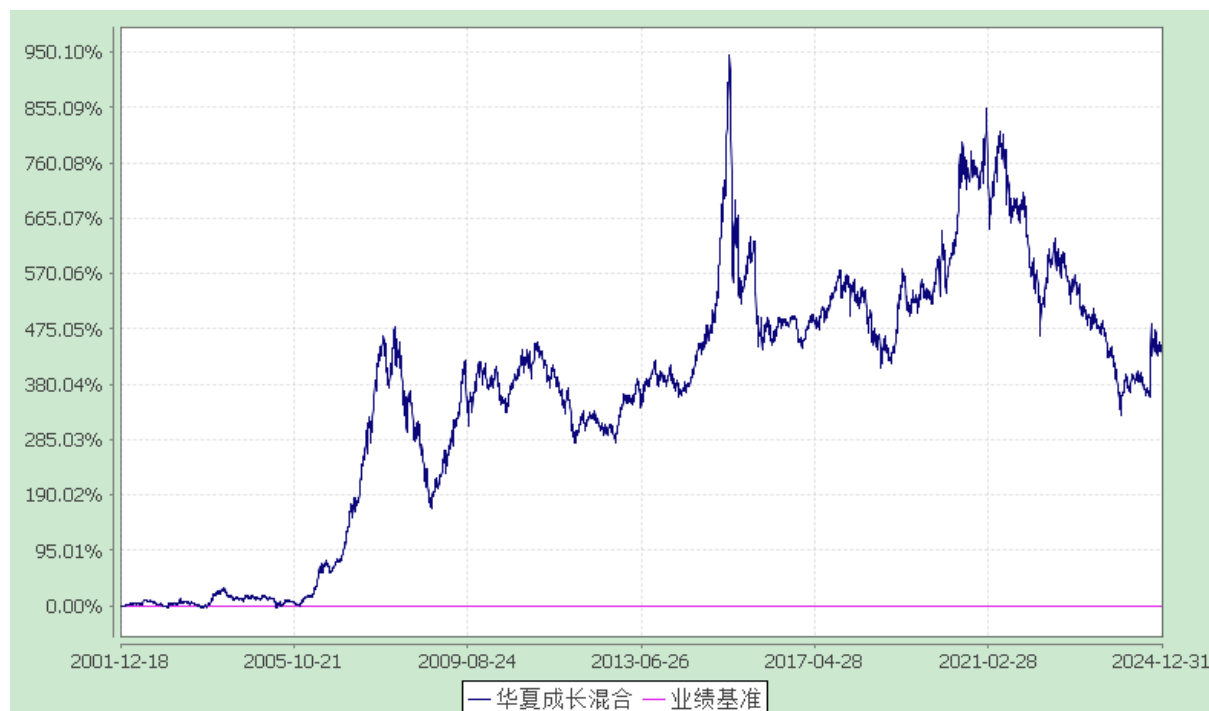
份额累计净值增长率与业绩比较基准收益率历史走势对比图 (2001年12月18日至2024年12月31日)