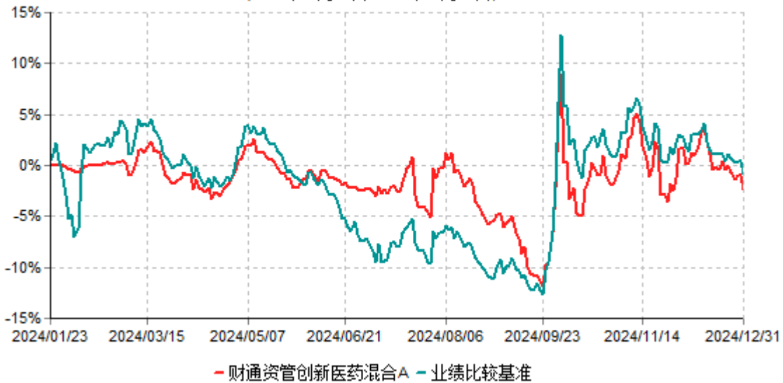
财通资管创新医药混合A累计净值增长率与业绩比较基准收益率历史走势对比图 (2024年01月23日-2024年12月31日)