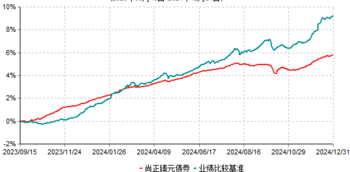
尚正臻元债券累计净值增长率与业绩比较基准收益率历史走势对比图 (2023年09月15日-2024年12月31日)

注:按照本基金的基金合同和招募说明书的规定,本基金自基金合同生效之日起的6个月内为建仓期,建仓期结束时本基金的各项资产配置比例符合基金合同的相关约定。