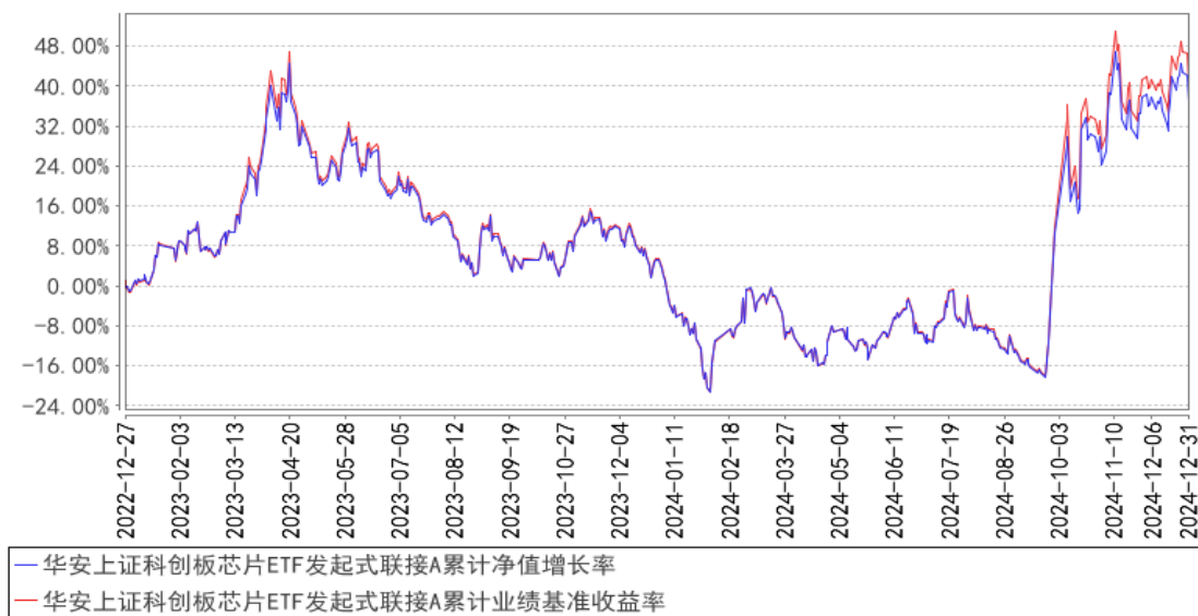
华安上证科创板芯片ETF发起式联接A累计净值增长率与同期业绩比较基准收益率的历史走势对比图