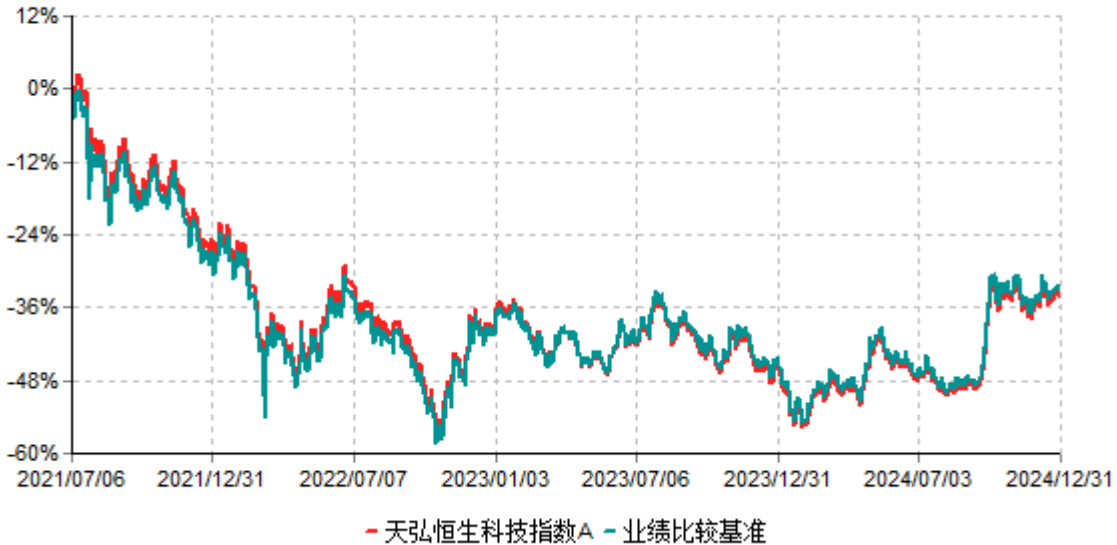
天弘恒生科技指数A累计净值增长率与业绩比较基准收益率历史走势对比图 (2021年07月06日-2024年12月31日)