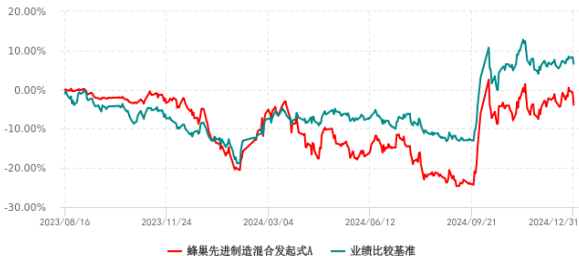
蜂巢先进制造混合发起式A累计净值增长率与业绩比较基准收益率历史走势对比图 (2023年08月16日-2024年12月31日)