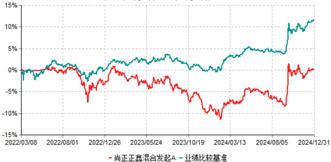
尚正正鑫混合发起A累计净值增长率与业绩比较基准收益率历史走势对比图 (2022年03月08日-2024年12月31日)