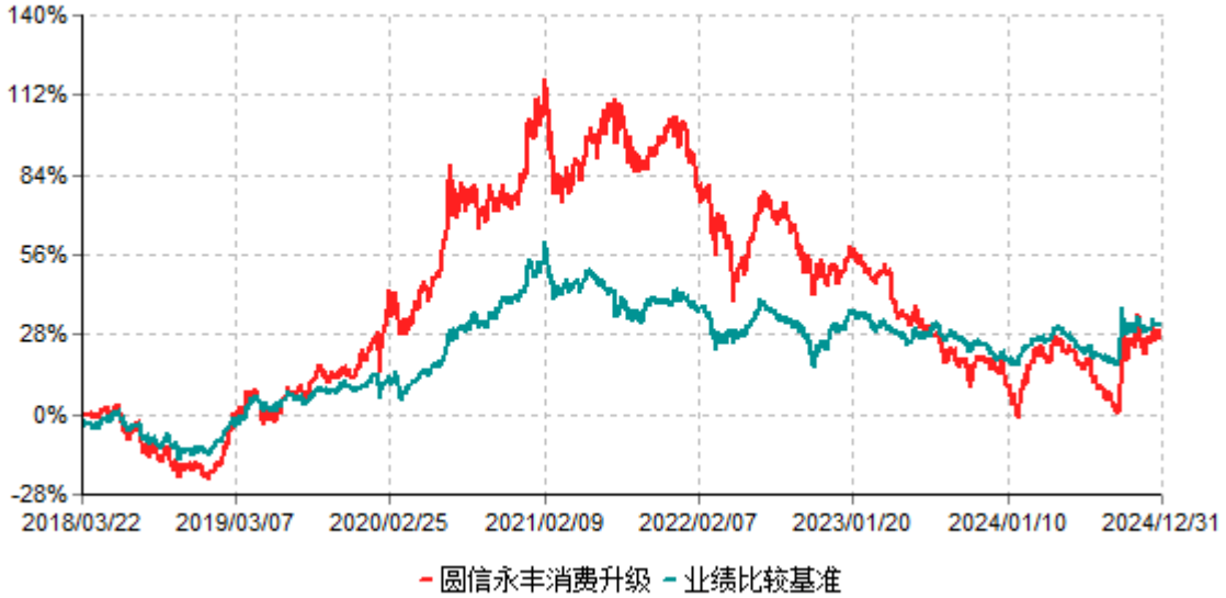
圆信永丰消费升级累计净值增长率与业绩比较基准收益率历史走势对比图 (2018年03月22日-2024年12月31日)