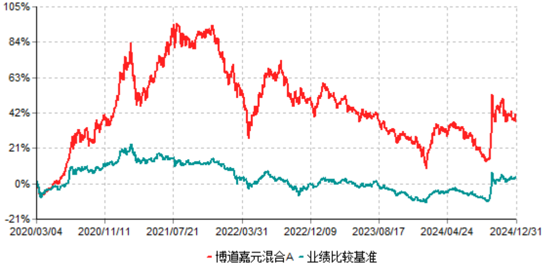
博道嘉元混合A累计净值增长率与业绩比较基准收益率历史走势对比图 (2020年03月04日-2024年12月31日)

注：本基金建仓期为自基金合同生效日起的6个月。截至建仓期结束，本基金各项资产配置比例符合基金合同及招募说明书有关投资比例的约定。