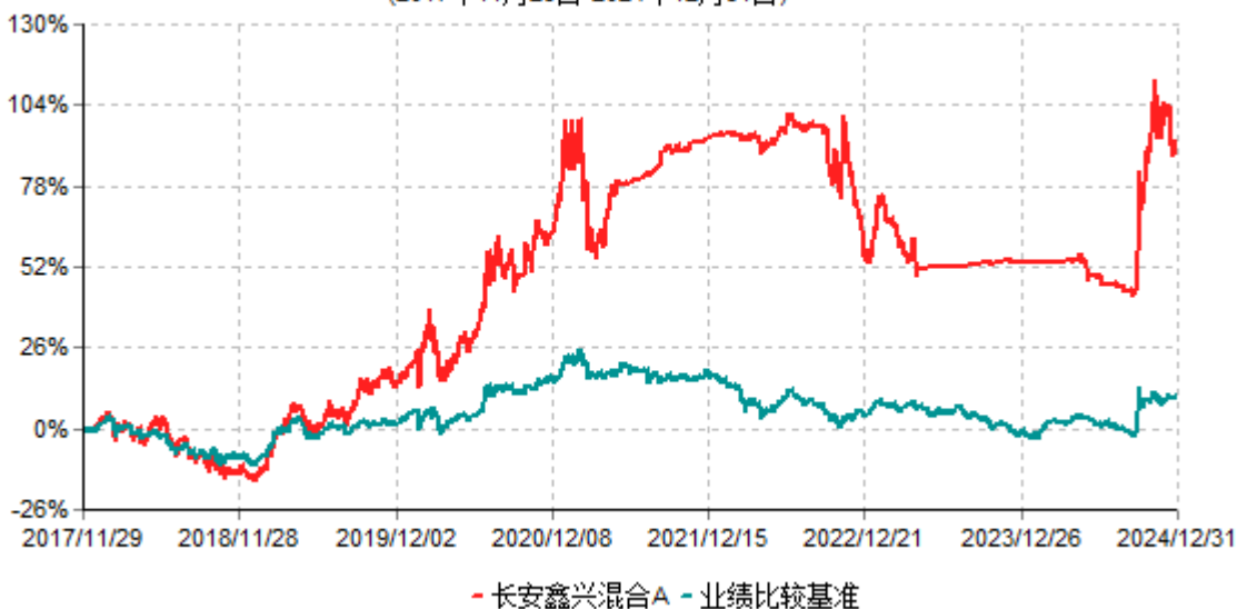
长安鑫兴混合A累计净值增长率与业绩比较基准收益率历史走势对比图 (2017年11月29日-2024年12月31日)

根据基金合同的规定,自基金合同生效之日起6个月内基金各项资产配置比例需符合基金合同要求。截止到建仓期结束时,本基金的各项投资组合比例已符合基金合同的相关规定。基金合同生效日至报告期期末,本基金运作时间已满一年。图示日期为2017年11月29日至2024年12月31日。