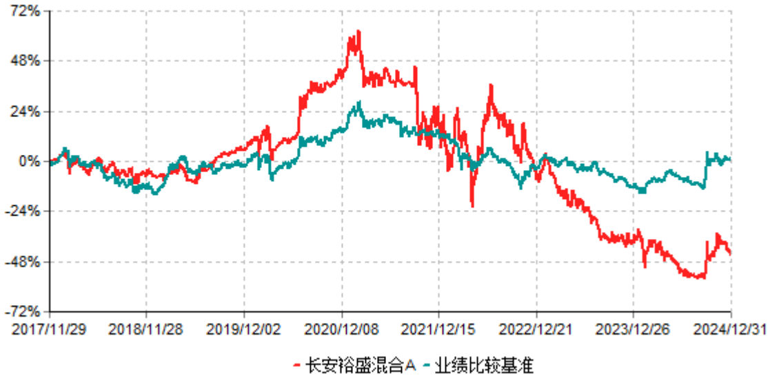
长安裕盛混合A累计净值增长率与业绩比较基准收益率历史走势对比图 (2017年11月29日-2024年12月31日)

根据基金合同的规定,自基金合同生效之日起6个月内基金各项资产配置比例需符合基金合同要求。本基金在建仓期结束后,各项资产配置比例已符合基金合同有关投资比例的约定。基金合同生效日至报告期期末,本基金运作时间超过一年。图示日期为2017年11月29日至2024年12月31日。