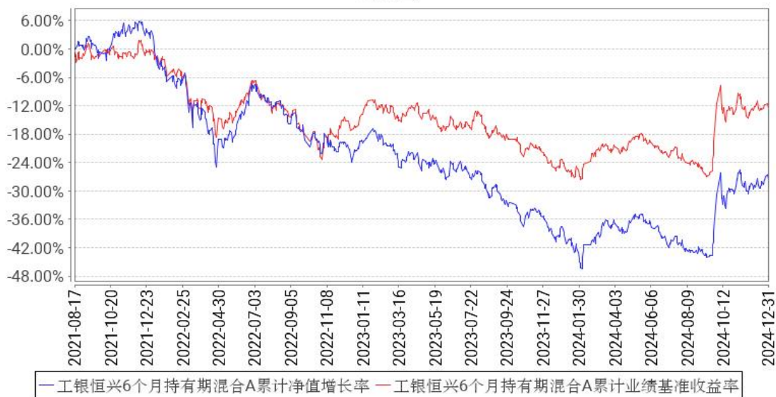
工银恒兴6个月持有期混合A累计净值增长率与同期业绩比较基准收益率的历史走势对比图