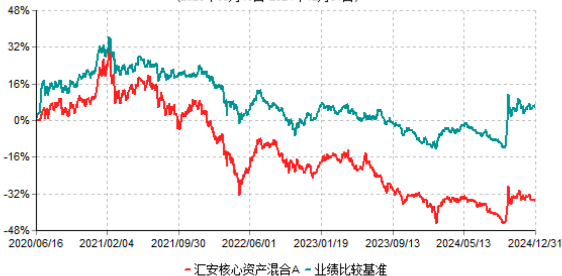
汇安核心资产混合A累计净值增长率与业绩比较基准收益率历史走势对比图 (2020年06月16日-2024年12月31日)