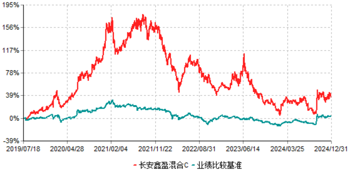
长安鑫盈混合C累计净值增长率与业绩比较基准收益率历史走势对比图 (2019年07月18日-2024年12月31日)

根据基金合同的规定,自基金合同生效之日起6个月内基金各项资产配置比例需符合基金合同要求。本基金在建仓期结束后,各项资产配置比例已符合基金合同有关投资比例的约定。基金合同生效日至报告期期末,本基金运作时间超过一年。图示日期为2019年07月18日至2024年12月31日止。