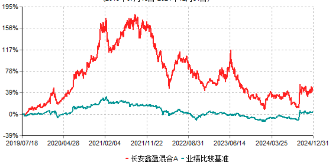
长安鑫盈混合A累计净值增长率与业绩比较基准收益率历史走势对比图 (2019年07月18日-2024年12月31日)

根据基金合同的规定,自基金合同生效之日起6个月内基金各项资产配置比例需符合基金合同要求。本基金在建仓期结束后,各项资产配置比例已符合基金合同有关投资比例的约定。基金合同生效日至报告期期末,本基金运作时间超过一年。图示日期为2019年07月18日至2024年12月31日止。