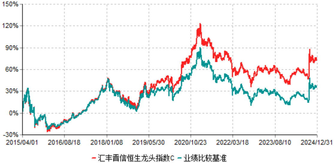
汇丰晋信恒生龙头指数C累计净值增长率与业绩比较基准收益率历史走势对比图 (2015年04月01日-2024年12月31日)