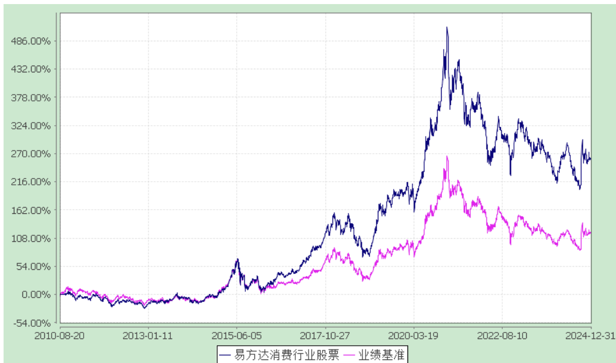
易方达消费行业股票型证券投资基金 份额累计净值增长率与业绩比较基准收益率历史走势对比图 (2010年8月20日至2024年12月31日)

注：自基金合同生效至报告期末，基金份额净值增长率为 259.30%，同期业绩比较基准收益率为 117.63%。