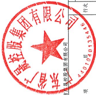
公司所有者权益变动表(续)