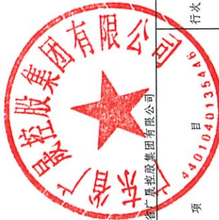
公司所有者权益变动表