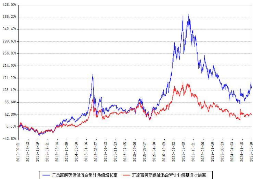
汇添富医药保健混合累计净值增长率与同期业绩基准收益率对比图

(二)自基金合同生效以来基金累计净值增长率变动及其与同期业绩比较基准收益率变动的比较图